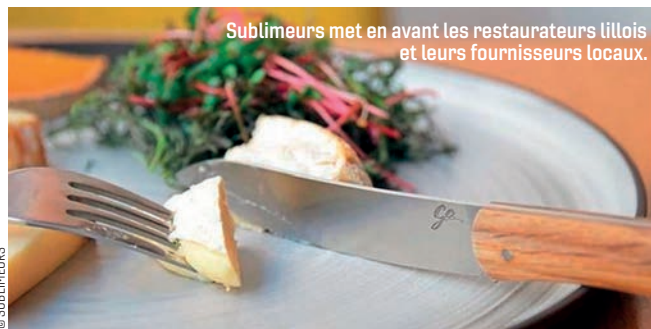
Sublimeurs met en avant les restaurateurs lillois et leurs fournisseurs locaux.

Service sur abonnement proposé aux restaurateurs et à leurs fournisseurs – commerçants ou artisans –, Sublimeurs