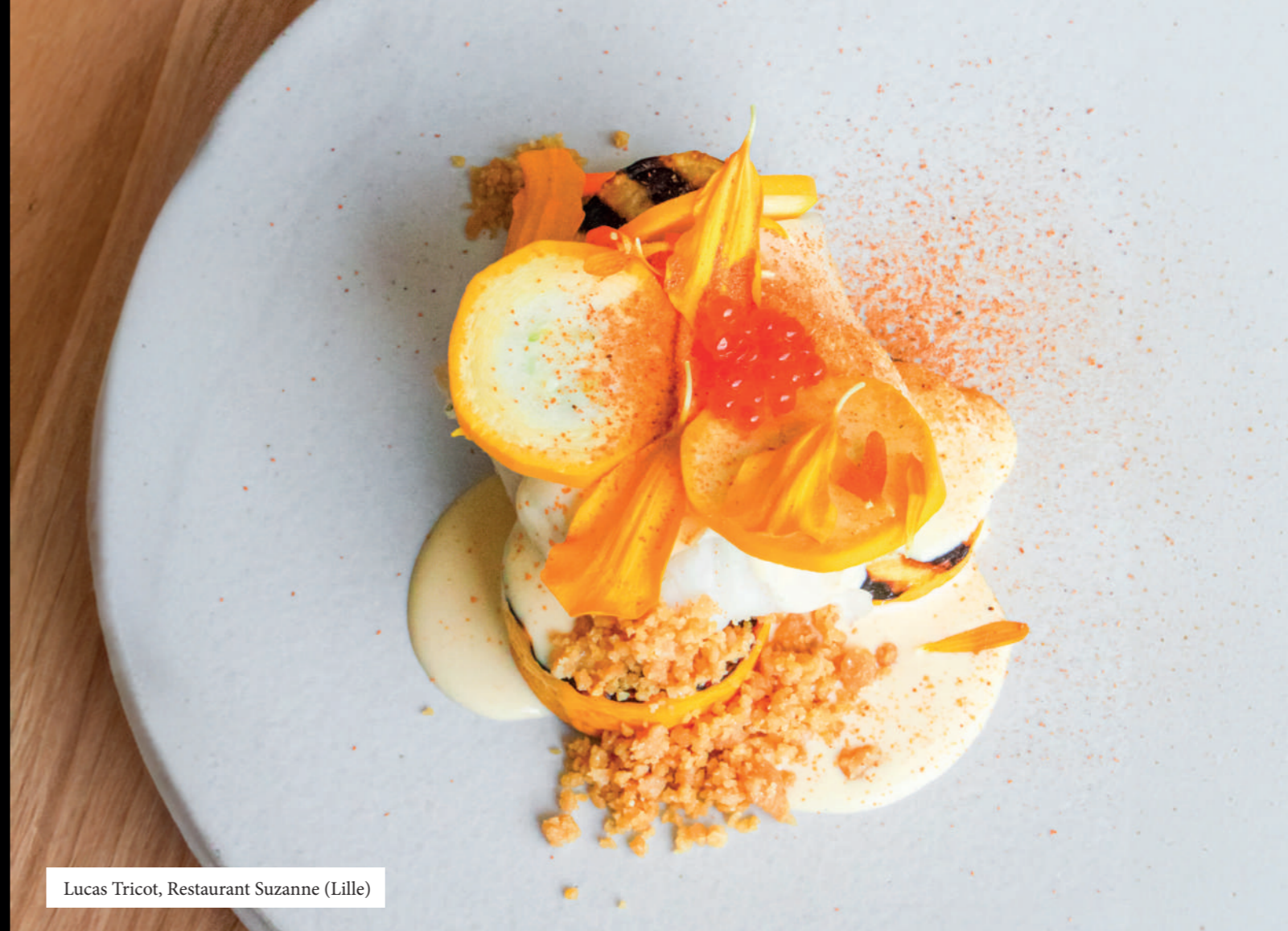
Lucas Tricot, Restaurant Suzanne (Lille)

Dénichant de merveilleuses pépites, qu'il s'agisse de cavistes, d'épiceries fines et même parfois de grossistes, ils complètent le panorama gastronomique en offrant au plus grand nombre l'accès à des produits de grande qualité, parfois méconnus ou insoupçonnés. Sélectionneurs de petites merveilles, des quatre coins de la région aux quatre coins du monde pour les produits les plus rares, ils participent également à construire une gastronomie responsable dans la région. Ils permettent aux cuisiniers et pâtisseries de réduire le nombre d'intermédiaires pour s'approvisionner. En plus d'être des sélectionneurs hors pair, ils sont bien souvent de véritables passeurs d'histoires des producteurs et artisans auprès desquels ils sourcent les produits.