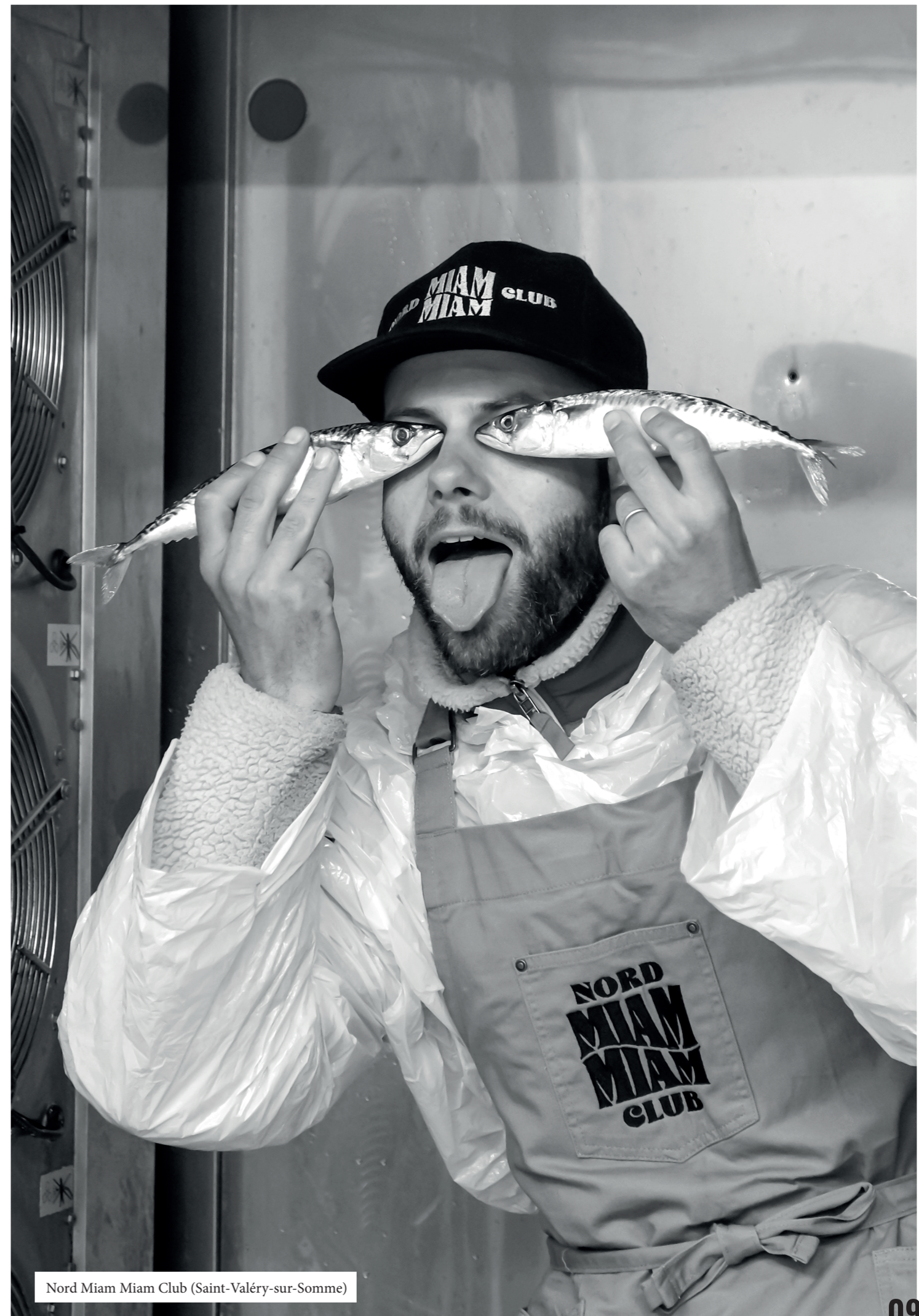
Nord Miam Miam Club (Saint-Valéry-sur-Somme)

LE BON pour valoriser et développer les engagements responsables de nos clients en faveur du bien manger en Hauts-de-France.