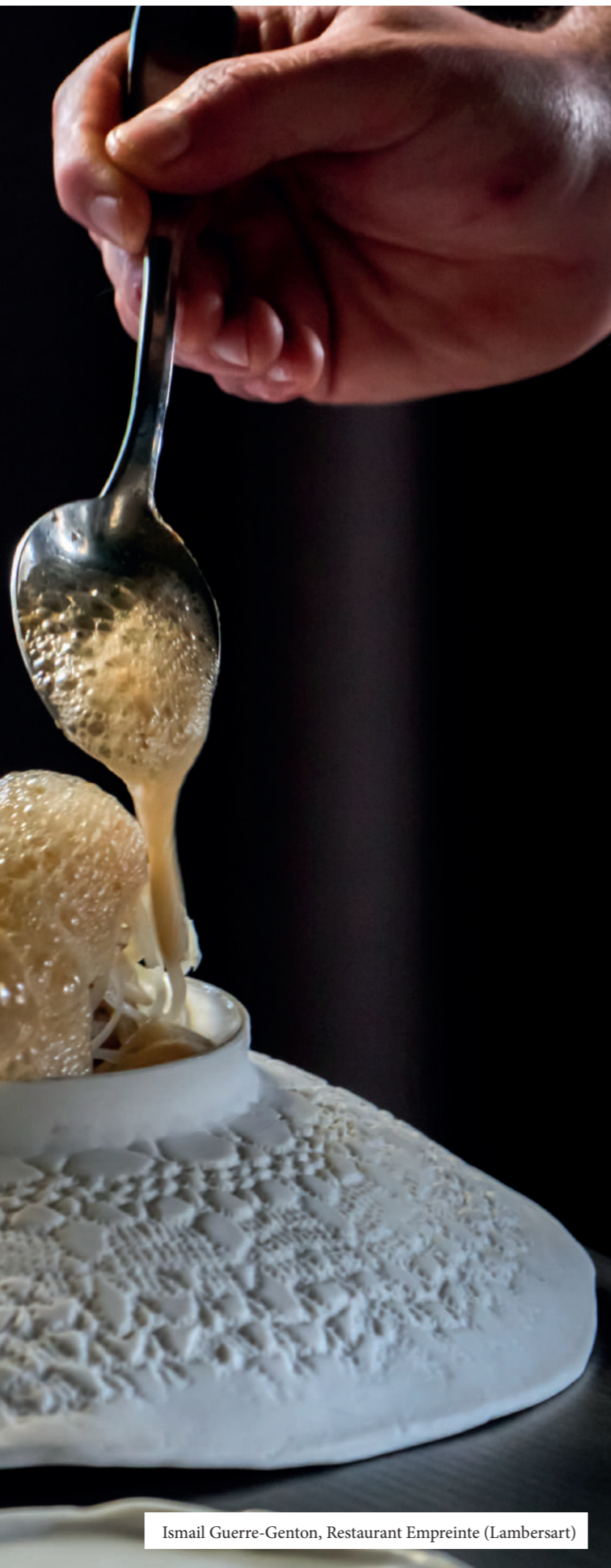
Ismail Guerre-Genton, Restaurant Empreinte (Lambersart)

Sublimeurs a pour vocation de transmettre le plaisir de bien manger en encourageant des acteurs de la gastronomie et de l'alimentation à développer leurs engagements responsables.